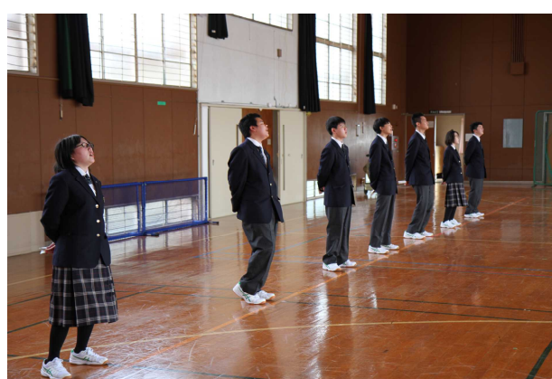
1年生もがんばります。