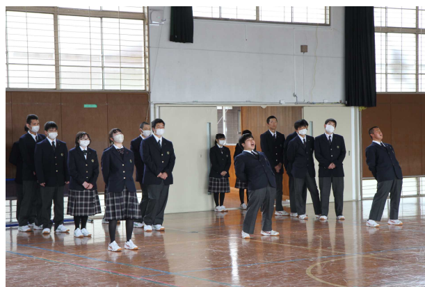
1年生のため、がんばっちゃいます！