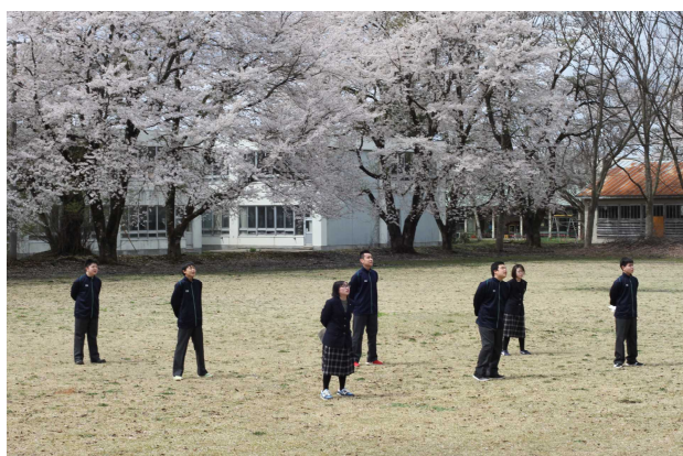
満開の桜のなか戸外練習する1年生。