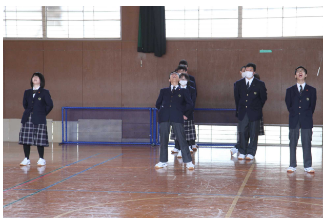
2年生も負けられません！